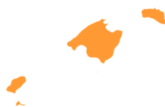
b) Illes Balears