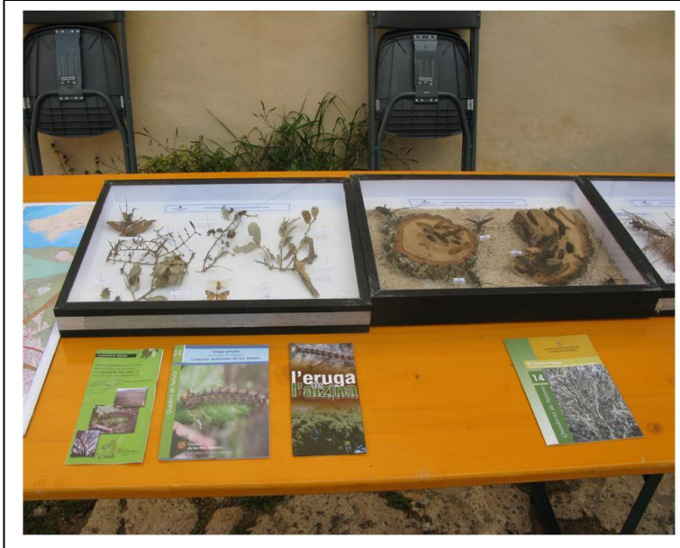
Foto nº 3: Vitrines d'eruga peluda ( Lymantria dispar ) i Banyarriquer ( Cerambyx cerdo )

Conselleria d'Agricultura, Medi Ambient i Territori Direcció General de Medi Natural, Educatió Ambiental i Canvi Climàtic