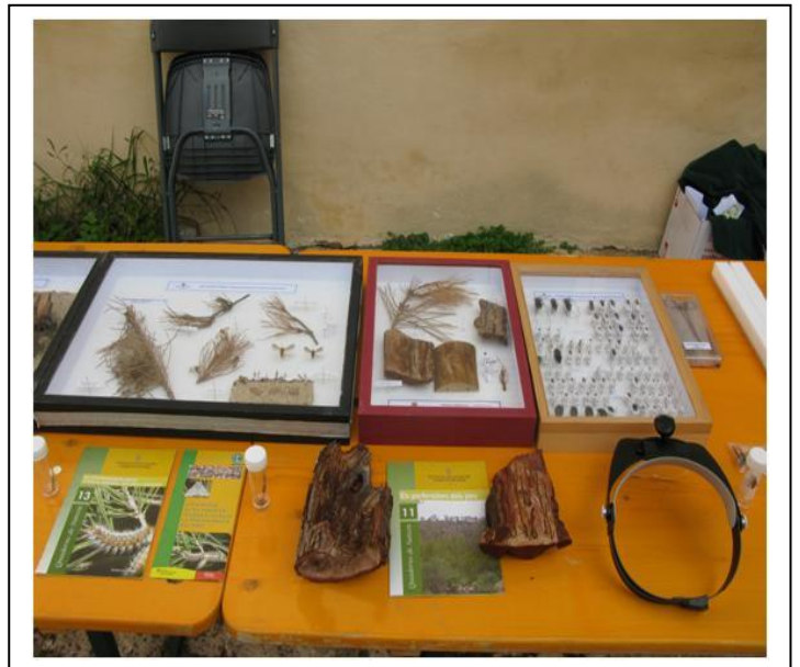
Foto nº 2: Vitrines de processionària, Tomicus destruens i del estudi de Monochamus galloprovincialis