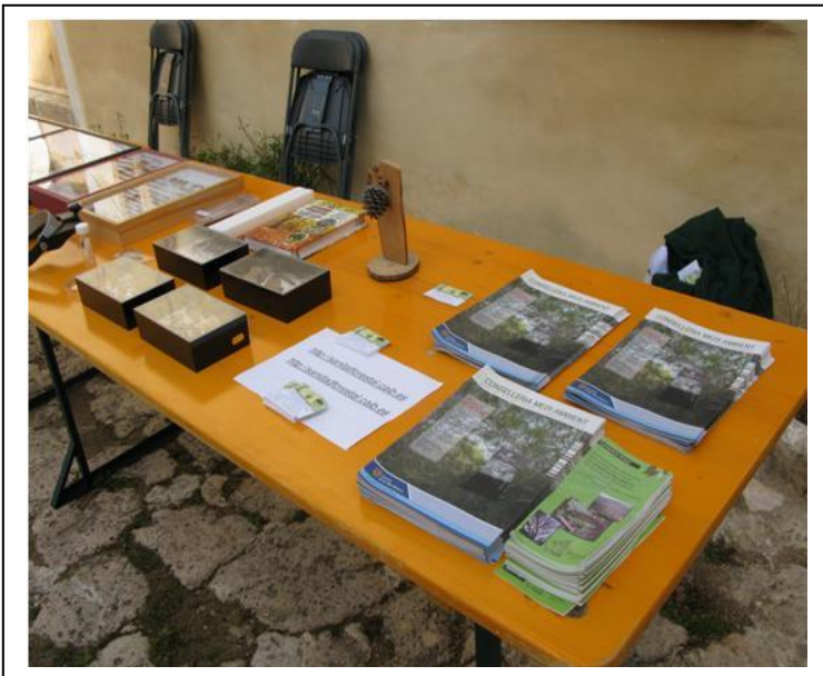
Foto nº 1: Fulletons de processionària i eruga peluda, altres vitrines i pàgina web del servei de sanitat forestal

També es va exposar una vitrina amb tots els insectes replegats d'una recerca científica feta a les parcel·les de seguiment de danys als boscos de Balears.