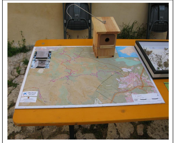
Foto nº 4: Mapa d'ubicació de les caixes niu d'aus insectívores col·locades la tardor-hivern de 2013

En camp: es va fer un demostració d'un tractament de lluita contra plagues forestals mitjançant el pick-up nebulitzador (es va aplicar aigua) i es va poder ver als operaris amb els equips de protecció individual (EPI's), juntament amb eines utilitzades en el control d'insectes com una motoserra i una peladora d'escorça d'arbres.