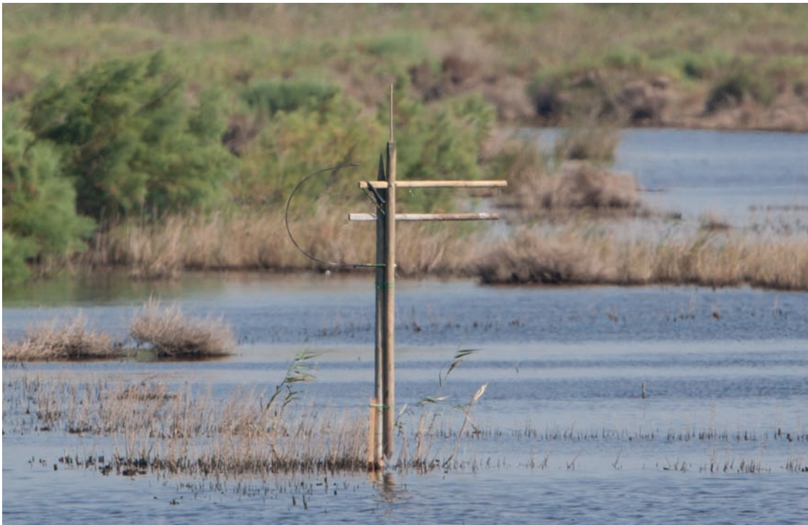
Posador col·locat en es Rotlos, amb la trampa adossada

Enguany s'han col·locat 4 nous posadors. Dos d'ells s'han instal·lat al NW del Salobrar de Campos, aprofitant una antiga línia elèctrica amb postes de fusta, avui desmantellada. Altres dos s'han col·locat a s'Albufera de Mallorca: un a la zona NW (les salades d'es Rotlos) i l'altre a la zona E (llacuna de l'avortada piscifactoria).