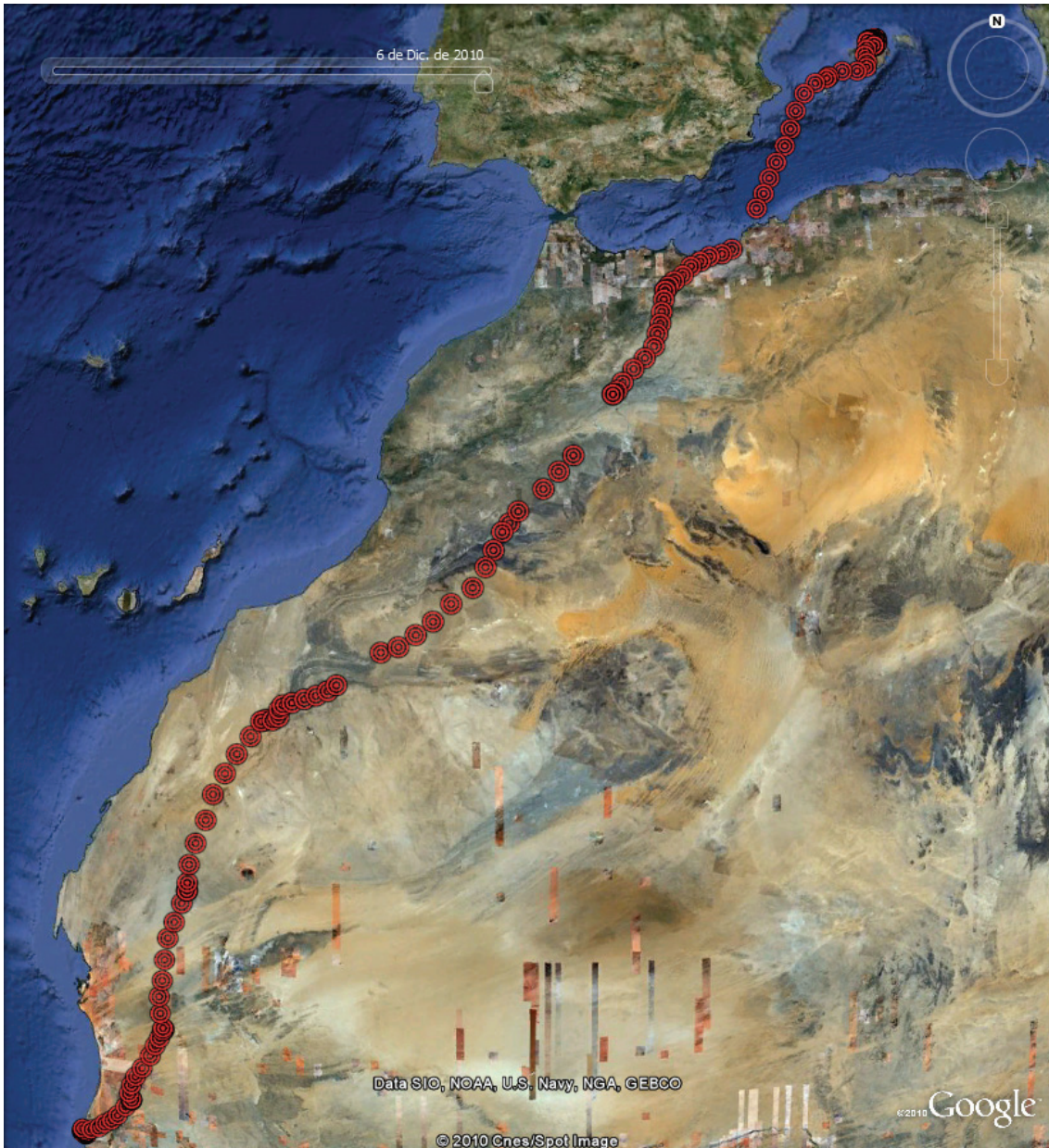
Detall de les localitzacions de l'exemplar 14 en el seu viatge de retorn prenupcial.