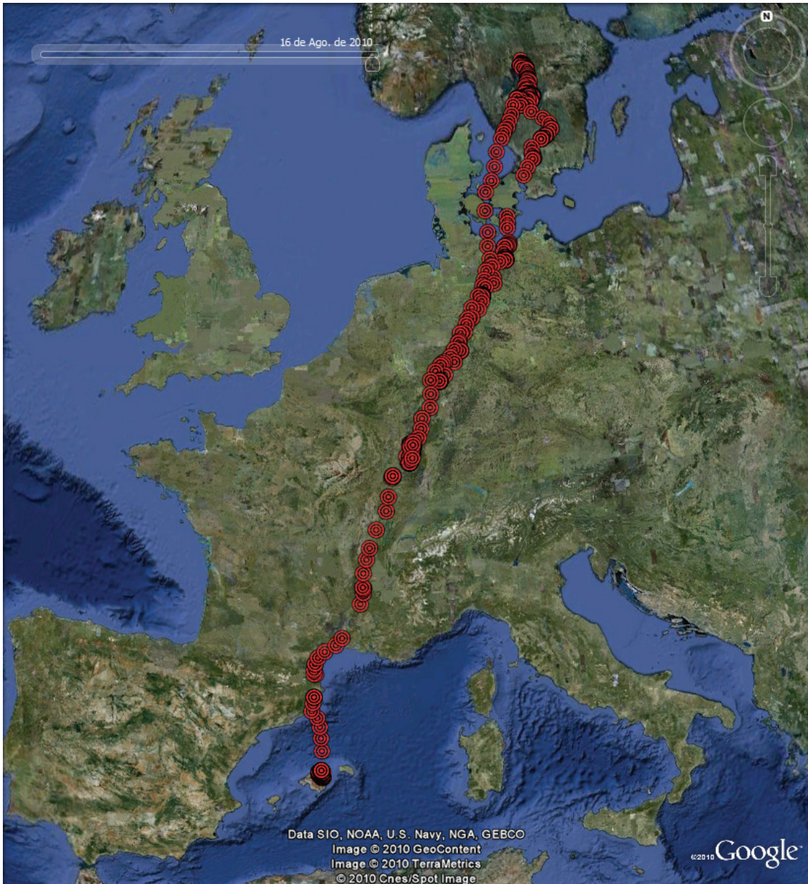
Detall de les localitzacions de l'exemplar 13 durant els seus viatges pre i postnupcial.