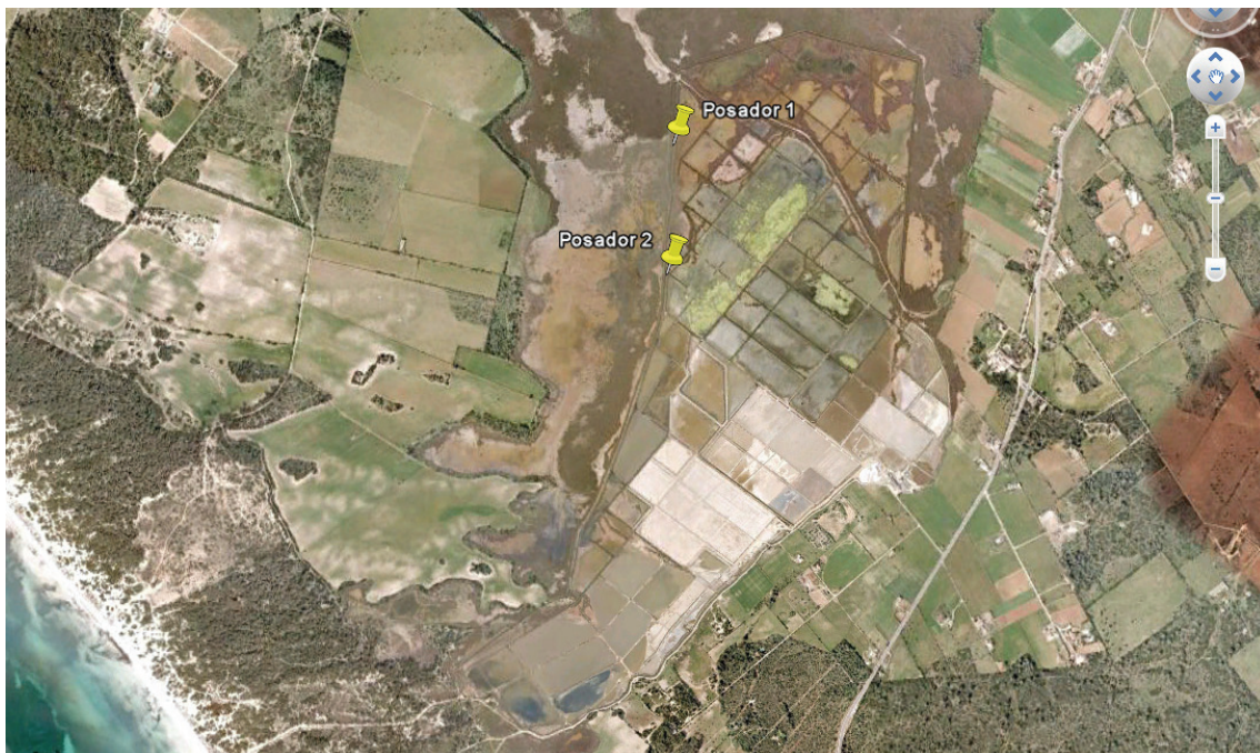
Nous posadors col·locats al Salobrar de Campos

La localització dels nous posadors apareix grafiada a continuació: