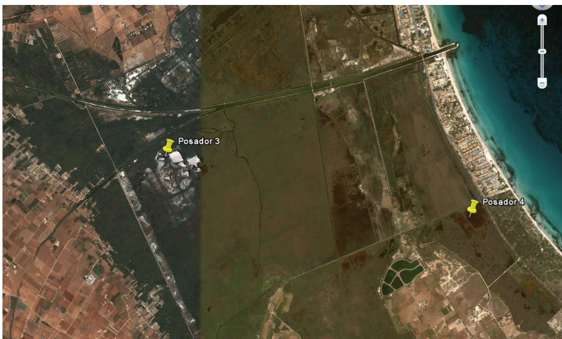
Nous posadors col·locats a s'Albufera

A excepció del posador 4, en el qual encara no s'ha registrat utilització, els altres tres posadors són emprats habitualment per diversos exemplars.