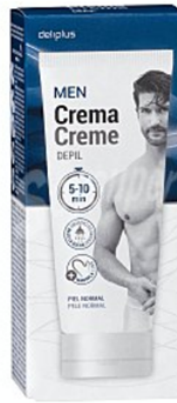
Caja de Deliplus Men Depil bajo la ducha