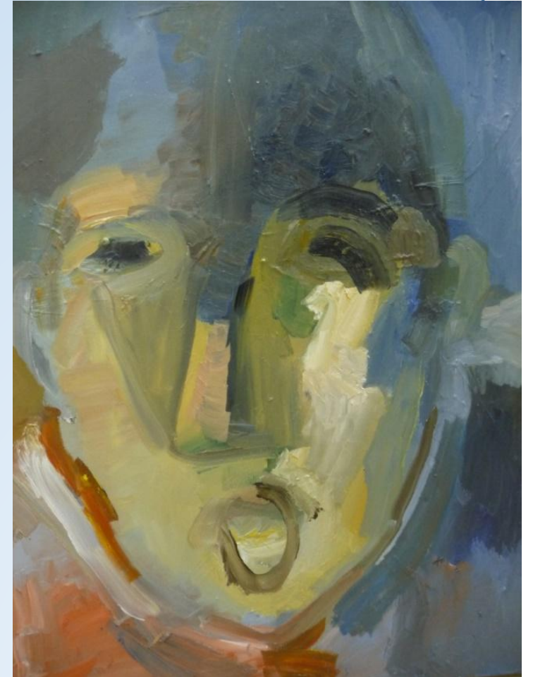
exposició de pintura Puro Arte