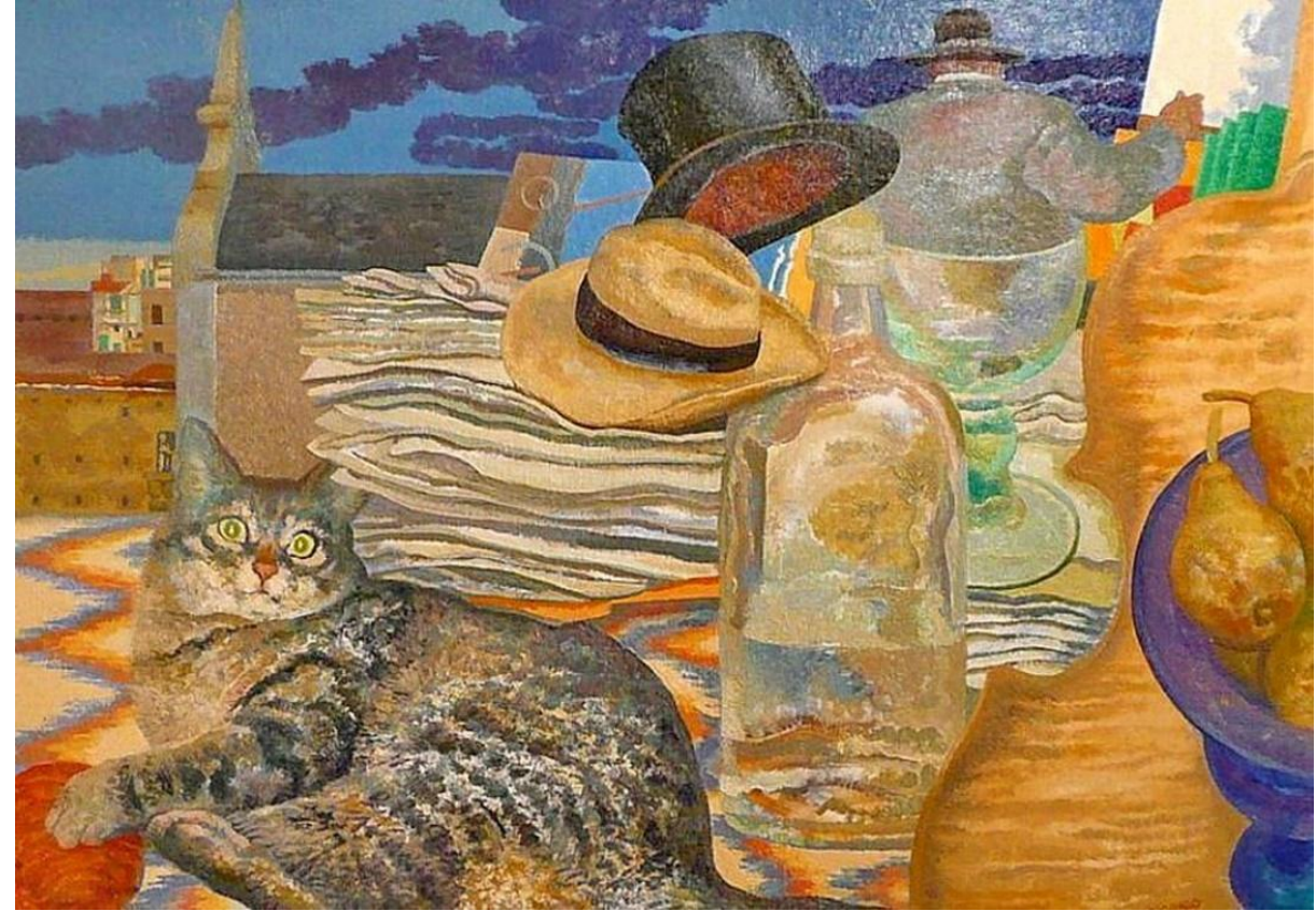
Ilustración Manuel Alcorlo

Situacions al final de la vida que poden presentar conflicte ètic: Com identificar-les?