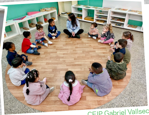
CEIP Gabriel Vallseca