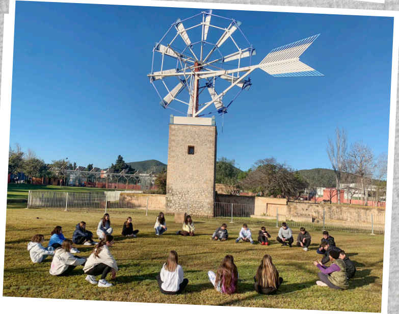
IES Isidor Machabich