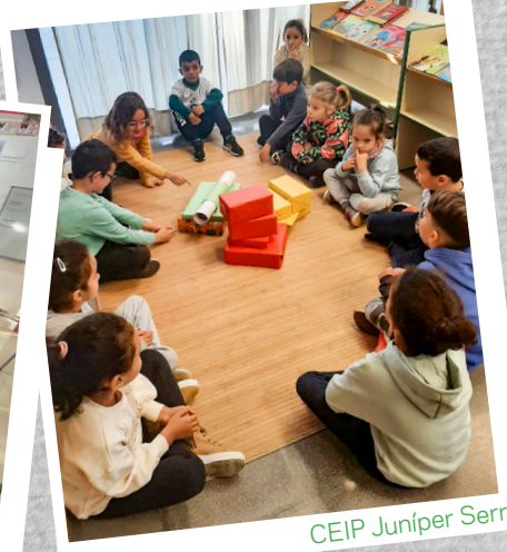
CEIP Juníper Serra