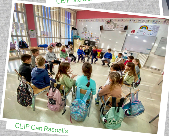
CEIP Can Raspalls