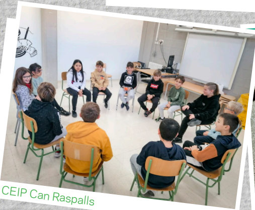
CEIP Can Raspalls