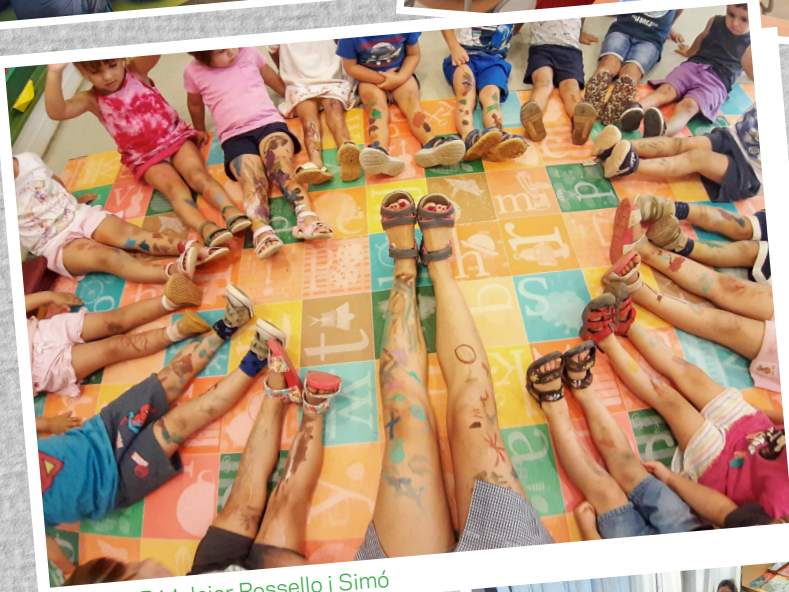
CEIP Melcior Rossello i Simó