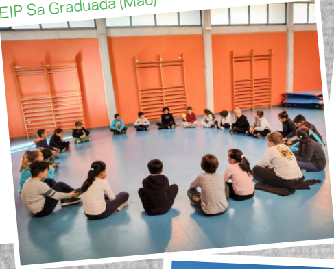
CEIP Sa Graduada (Maó)