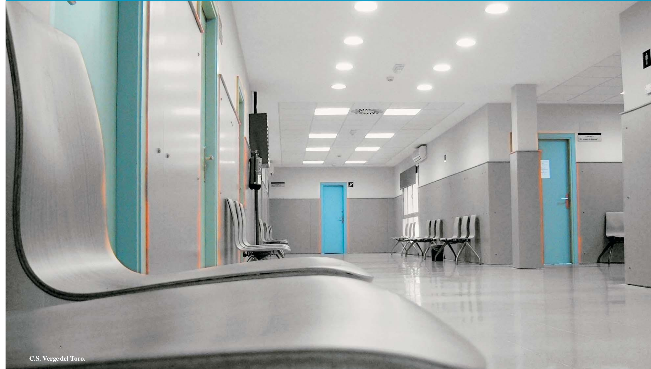
C.S. Verge del Toro.