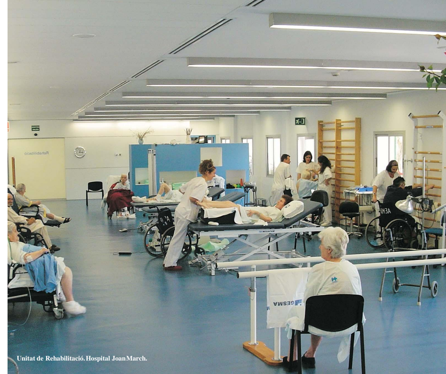
Unitat de Rehabilitació. Hospital Joan March.

Unitat de Treball Social: Tel. 971 212 125