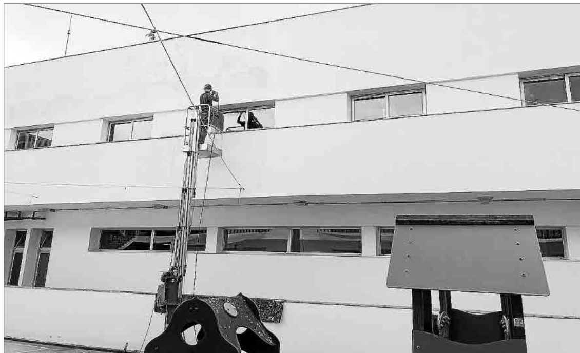
Un operario llevando a cabo actuaciones de mantenimiento en el CEIP Mestre Duran.

El equipo de gobierno se refiere, por un lado, a la reparación de las filtraciones de la cubierta del gimnasio del colegio Doctor Comas. Los desperfectos por goteras fueron comunicados al Govern para su arreglo, de ahí que la Conselleria de Educación licitara las obras por 29.000 euros. La empresa adjudicataria detectó en verano pasado que los desperfectos eran mayores de los previstos. Y desde entonces «la Conselleria no ha dado ningún paso para arreglar la cubierta», asegura el concejal de Educación, Cristóbal Marqués. Agrega que el Ayuntamiento ha invertido