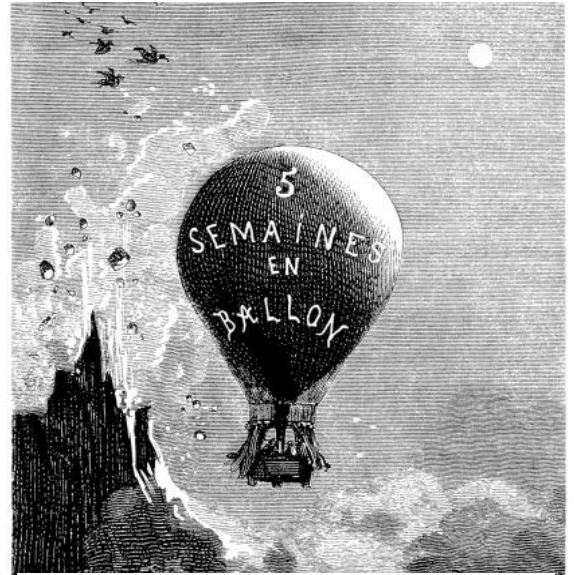
Il·lustració de l'obra Cinc setmanes en globus

Jules Verne va néixer a la ciutat portuària de Nantes, a França, el 8 de febrer de 1828. Fill d'una família burgesa, primer es va dedicar a la borsa, però la seva passió real era l'escriptura. Cinc setmanes en globus va ser la primera obra publicada de l'autor, el 31 de gener de 1865, quan tenia 34 anys. Al principi, cap editor la hi va voler publicar, però Pierre-Jules Netzel, editor i també escriptor, va veure el potencial de l'escrit i va signar un contracte amb Verne. A partir de llavors, tot va anar sobre rodes i l'escriptor va anar publicant un èxit rere l'altre. En poc temps, ja s'havia convertit en un dels autors més llegits de tot Europa, i les seves obres van ser traduïdes a molts idiomes. Però no tothom estava tan content amb els escrits de Verne: els literats consideraven que les seves històries eren vulgars i de poca qualitat.