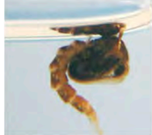
▲ Pupa del moscard tigre Pupa del mosquito tigre

El mosquito tigre (Aedes albopictus) es originario del suroeste asiático. El verano de 2012 se detectó por primera vez en Mallorca.