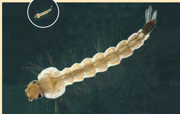
Imatge ampliada d'una larva del moscard tigre Imagen ampliada de una larva del mosquito tigre